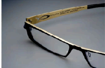
Parax – Macfay – 09 Precious

что компания-производитель готова предложить очки и очки не только для тех, кто хочет выглядеть, как будущий олигарх, и так, кто в них подражает мисс-мисс, для леди, мысленно и строгих, для бездельных романтиков и нежных романтиков.